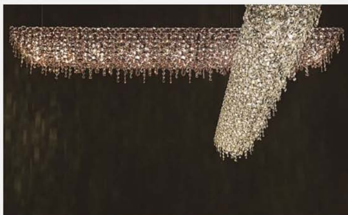
U-Line, lampada a sospensione di Lolli e Memmoli

La luce su misura un progetto da personalizzare a proprio piacere.