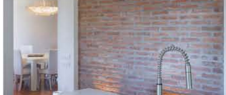
Sopra il tavolo per il pranzo (parapetto) lampadario di Lotti e Bionetti ( www.fallinimemmi.it )

La scelta dei materiali determina il mood del bagno privato della stanza doppia. Pareti, mobile sottobagno (disegnato su misura) e bordo vasca sono in cemento resinato; un trattamento la cui applicazione ha tempi lunghi ed è costoso, ma dai risultati impagabili che durano nel tempo. Vale senz'altro la pena di considerare magari per piccoli superfici. Diverse le possibili finiture, qui si sceglie la versione salinata. Tutto concorre a rendere sobrio questo ambiente: il box doccia (di Vitrina, www.vitrinarivetro.it ), i sanitari (modello Link di Flaminio, www.flaminio.com ) e la vasca ovale (di Novich, www.novich-design.com ). Raffinata la tinta grigio nebbia delle pareti.